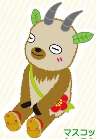
マスコット キャラクター 「しろっぺ」