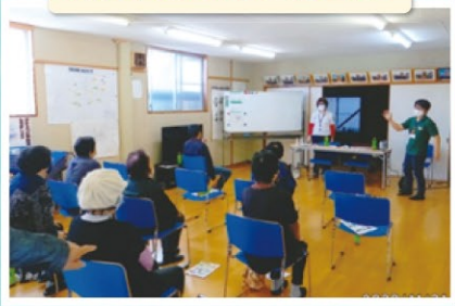
介護・認知症講座