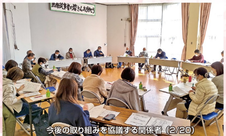
今後の取り組みを協議する関係者 (2/20)

より良いまちづくりのための2021年からの次期5ヶ年計画が、2月13日の臨時総会で議決されました。本号ではその内容を中心にお知らせします。