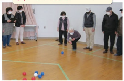
普段の練習成果が