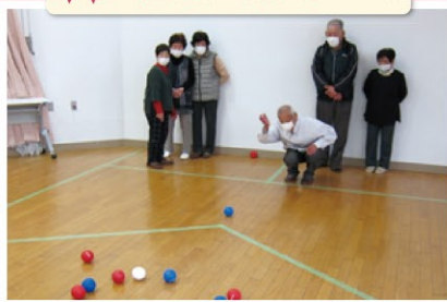
投球に気合が入って