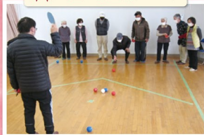
私の一球で逆転だ