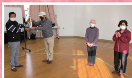
和田会長から優勝の北門チームへ 優勝トロフィーの授与