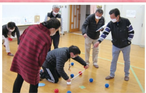
ふくしあからの審判が計測中