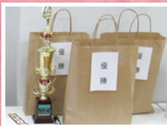
優勝トロフィーと豪華賞品